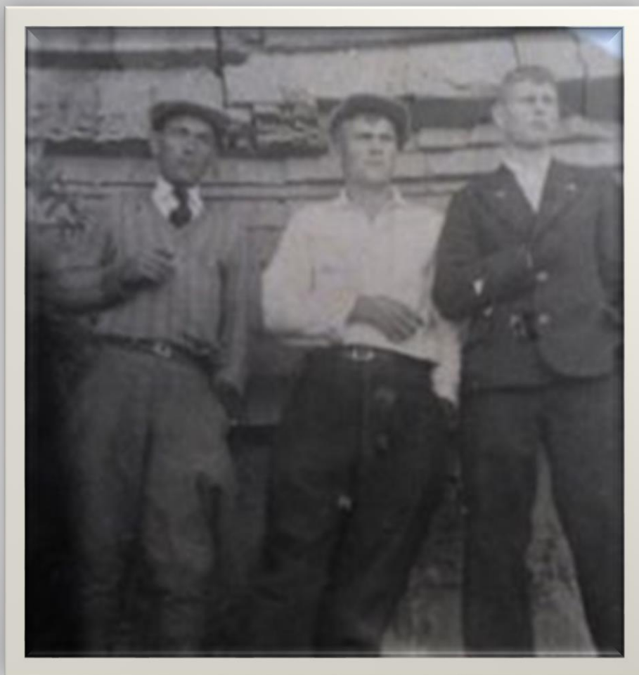
Прииск Центральный 1941 г –лето. С братом